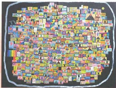
Beautiful world 荘司 久寿(秋田県)