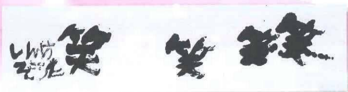
笑笑 新家 壮太(福井県)